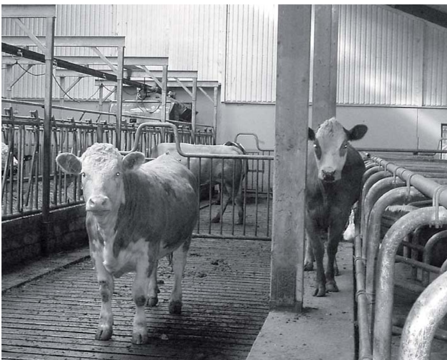
Två kossor i den nya ladugården